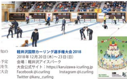
軽井沢国際カーリング選手権大会2018 2018年12月20日(木)～23日(日) 会場：軽井沢アイスパーク 大会公式サイト：https://karuzawa-curling.jp Facebook @i.curling Instagram @i.curling Twitter @karu_curling

今年の大会も、国内外からトップチームが軽井沢に集結する予定です。ぜひ会場にお越しください。氷上で繰り広げられる熱戦を生でお楽しみください。出場チームや対戦表などの詳細は、順次大会オフィシャルサイトやSNSでご案内していきます。