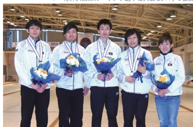
▼「軽井沢国際カーリング選手権大会2011」で優勝

チームは今年、オフィシャルファンクラブを立ち上げました。ウェブサイトも開設し、入会を募っています。皆さまのあたたかい応援をよろしくお願いたします。