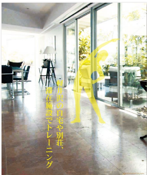
軽井沢の自宅や別荘、滞在施設でトレーニング

トレーニングルームのトレーナーが、ご自宅や別荘、滞在先の宿泊施設などに赴いてマンツーマンで指導いたします。出張エリアは軽井沢町内と御代田町の一部です。肩こりや倦怠感といった身体の不調改善から、体幹や腹筋などのパーツ強化、ダイエットやケガ予防など目的に合わせて行います。どうぞお気軽にお問い合わせください。