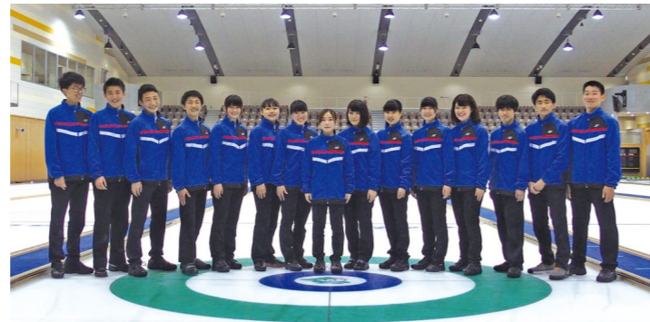
▲2019年度アカデミー生