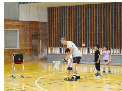
※ラケットの無料レンタルあります

日本プロテニス協会認定コーチ指導の下、幼少から基本を身につけ、テニスを楽しみましょう。