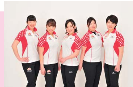
▼中部電力カーリング部