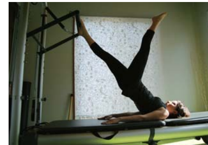
グループ・プライベートで行う ピラティス・ヨガレッスン

心身の内側を意識して行うことで、身体の芯からしなやかにします。弱くなりやすい筋肉をほぐし、強化し、身体のゆがみを改善して全身を整えます。ゆっくりと深い呼吸によって自律神経にも働きかけ、リラックスさせる効果もあります。姿勢やボディラインを