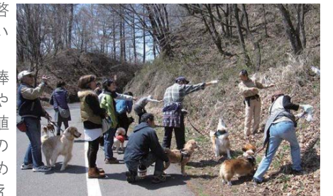
▲やぶに向かって「吠える」の練習

活動に興味のある方は、facebook「軽井沢Forest Ranger Dog」をご覧ください。