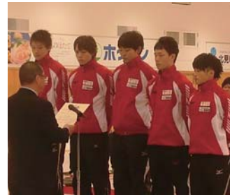
女子：御代田CCジュニア、軽井沢ジュニア(※)が出場しました。 ※軽井沢カーリング少年団選抜チーム

昨年11月27日から12月1日、「第22回日本ジュニアカーリング選手権」が北海道北見市にオープンしたばかりの通年型施設・アドヴィックス常呂カーリングホールで行われました。長野県からは4チーム(男子：長野県CAジュニア、軽井沢ジュニア(※)／