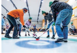
カーリングの法人向けプログラムもござい ます。詳しくは公式サイトをご覧ください

開催: 上記の施設公式サイト 「お知らせNEWS」をご参照ください 対象年齢: 5歳以上 ※小学4年生以 下のお子様には保護者同伴必須 持ち物: 動きやすい長袖・長ズボン、 ニット帽子、手袋、靴下 注意事項: 体験時間の30分前まで に受付をお済ませください 参加料: 体験90分3,410円