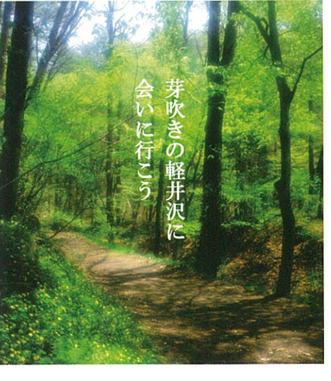
芽吹きの新緑の軽井沢に会いに行こう

<お問い合わせ> 軽井沢ツーデーウォーク実行委員会(スポーツコミュニティ軽井沢クラブ内) TEL 0267-44-6680 http://www.karuizawaclub.ne.jp/2daywalk/