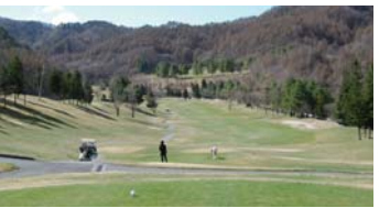
*当クラブが運営をサポートするスポーツ愛好会

10月中旬に開催100回を迎えるクラブでは、記念行事を企画中。またレッスンプログラムを招いて、会員向けイベントも開催予定です。