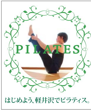
はじめよう、軽井沢でピラティス。

*上記は当クラブ会員(別途年会費5,000円)料金です。ビジター料金はお問い合わせください *レッスン時間は変更になる場合があります