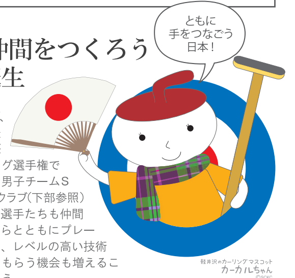
軽井沢カーリングマスコット カーカルちゃん

クラブに関するお問い合わせ、お申し込み 軽井沢カーリングクラブ事務局(スポーツコミュニティ軽井沢クラブ内) TEL 0267-44-6680 FAX 0267-44-6681 Mail info@karuizawa-curlingclub.jp/ http://www.karuizawa-curlingclub.jp/